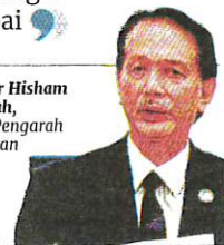
Dr Noor Hisham Abdullah, Ketua Pengarah Kesihatan

Dr Noor Hisham berkata, merokok bukan sahaja mendatangkan kemudaratan kepada diri, malah ia membahayakan orang yang berada di sekeliling.