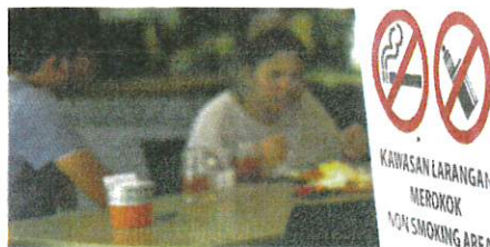
PRESMA sokong RUU Kawalan Rokok dan Produk Tembakau 2022