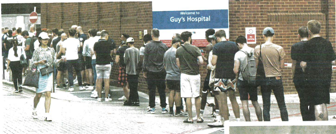
ORANG ramai beratur bagi menunggu giliran untuk mendapatkan vaksin cacar monyet di sebuah klinik di London, serualam.

lam tempoh seminggu memecah 261 kes. Pertubuhan Kesihatan Sedunia (WHO) pada minggu lalu mengisytiharkan kecamasan kesihatan global susulan penularan wabak cacar monyet.