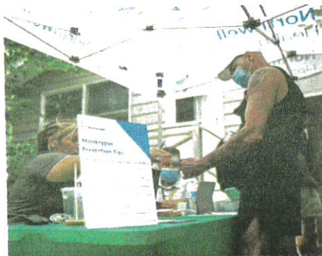
SEORANG lelaki hadir ke sebuah pusat kesihatan di New York bagi menerima vaksin cacar monyet.