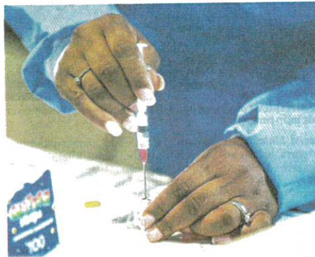
PETUGAS di Pusat Kesihatan Westchester di New York menyediakan vaksin cacar monyet yang diberikan secara pandu lalu.